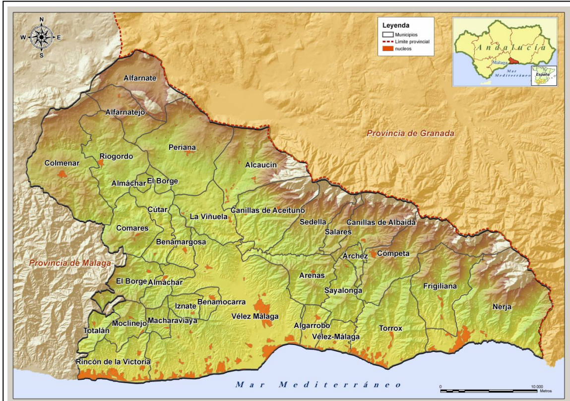
Imagen 2: Comarca de la Axarquía