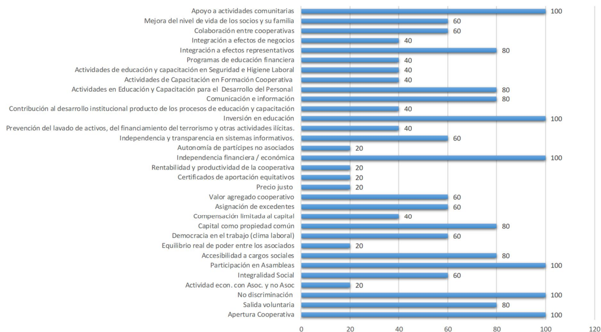
Gráfico 1. Variables del Balance Social Cooperativo

educación financiera y cooperativa; se considera pertinente agregar las siguientes cinco variables: